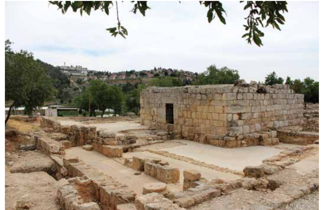
מסגד אל-יתים הבנוי על כניסה ביזנטית