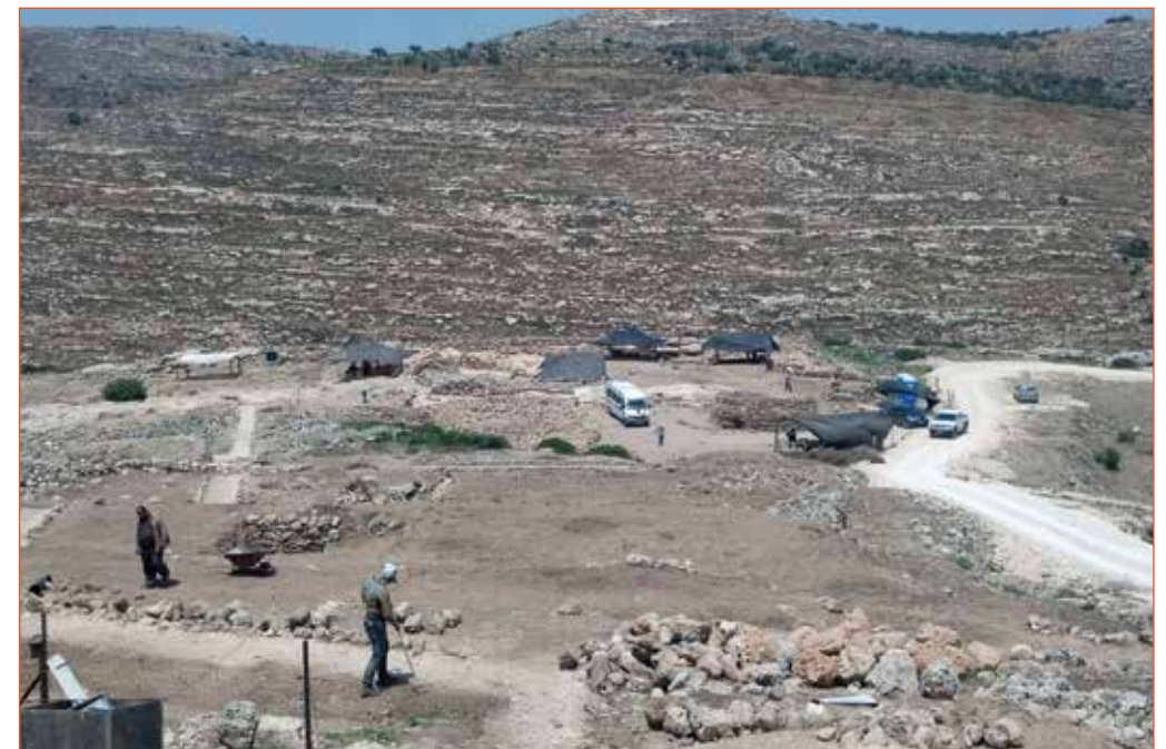
חפירות בצפון התל – חיפוש אחרי מיקום המשכן?