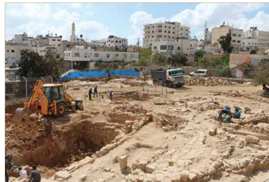
שרידי מבנים מהתקופה הרומית-ביזנטית בחלקה הדרומית-מזרחית בתל רומיידה