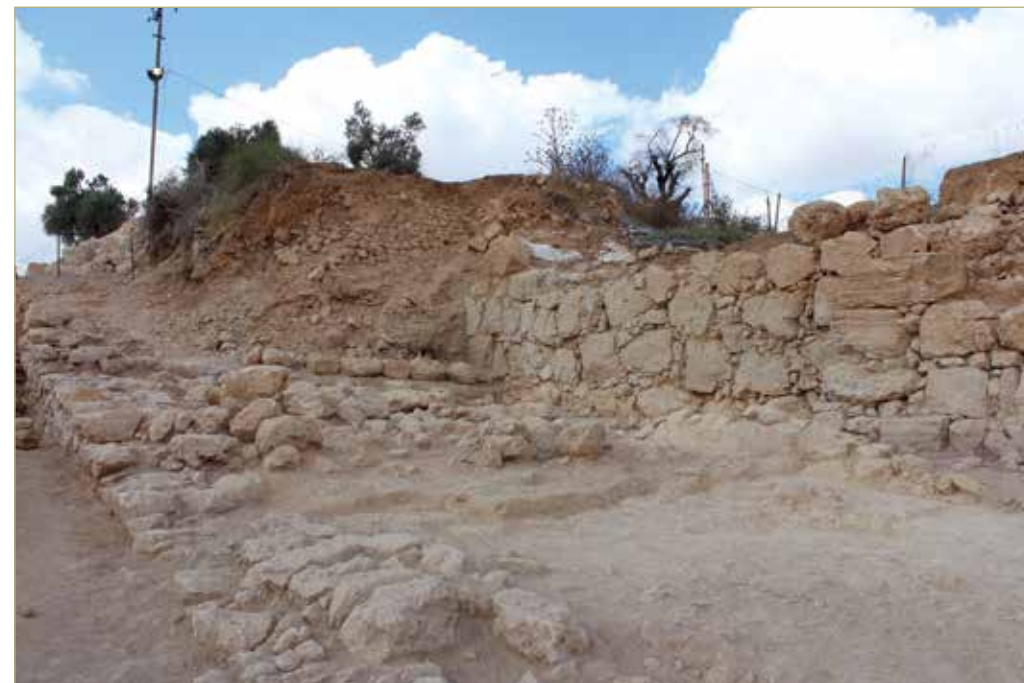
חומת הברונזה התיכונה והרס הטראסה של משפחת אבו-הייכל בחלקה הדרומית-מזרחית

השימוש באתרי עתיקות להבאת מבקרים וחיזוק הלגיטימציה של ההתנחלות מוכרים מאתרים רבים בגדה המערבית, כמו סילוואן ("עיר דוד"), סוסיא, תל שילה ועוד. המקרה של חברון/תל רומיידה הוא ייחודי, מכיוון שהפארק הארכיאולוגי עתיד להשתרע באחד המקומות הרגישים ביותר בעיה, בשטח שבו הפלסטינים והישראלים גרים בשכנות והחיכוכים בין הצדדים הם עניין שבשגרה.