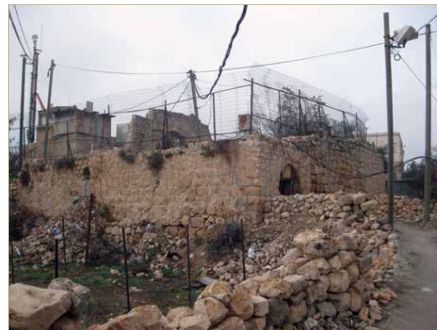
מתחם דיר אל ארבעין - נקודת תצפית של הצבא על גג המבנה

המסלול רווי תכנים בעלי זיקה דתית-מסורתית (טבילה במעיין, אירועים מקראיים, מתים ונרצחים, קבר קדוש שיש בו בית כנסת ועוד) ופונה בעיקר לציבור דתי או מסורתי, המכיר תכנים אלו ומזדהה עימם. ואילו הפארק הארכיאולוגי המתוכנן, בדגש על החקלאות בתקופת המקרא, נועד לפנות לקהל חדש ולמשוך אותו לביקור או לעבודה במקום. 17 לצורך זה גויסה הארכיאולוגיה, הממלאת כאן תפקיד מרכזי.