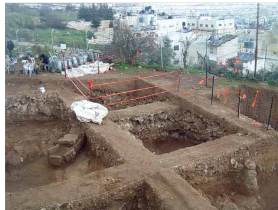
קברים, שרידי מבנה וממגורה שנחשפו בחלקה הצפונית-מערבית בתל רומיידה