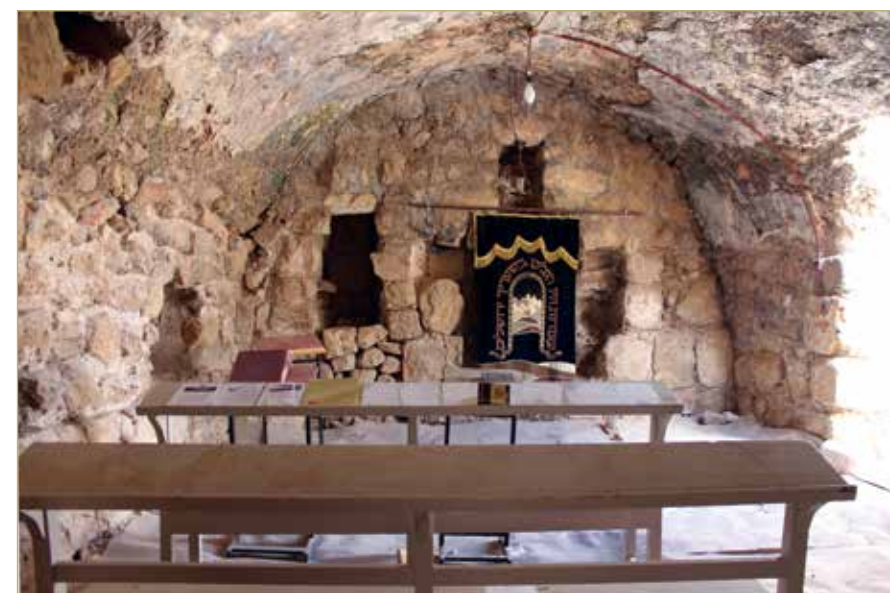
דיר אל ארבעין - פנים המבנה. המסגד הוסב לבית כנסת בחסות הצבא ומכונה "קבר ישי ורות"