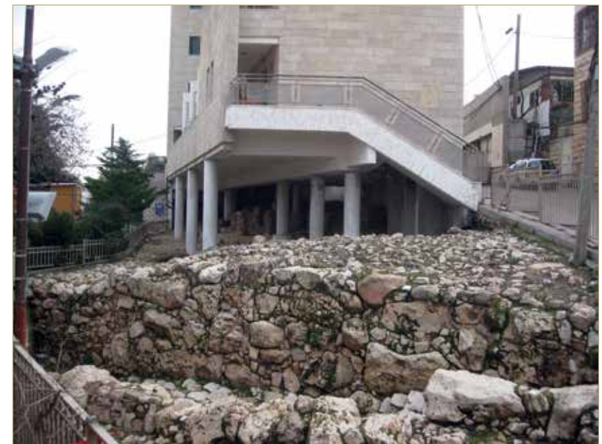
מבנה מודרני של ההתנחלות היהודית, שכונת "אדמות ישי", שהוקם מעל לשרידי החומה מתקופת הברונזה הקדומה III (חפירות 1999).

החפירות הראשונות במקום נערכו בתקופת השלטון הירדני, בשנים 1964-1966, על ידי הארכיאולוג האמריקאי המונד (Ph. Hammond). 2 הקרוונים הראשונים של ההתנחלות היהודית בתל רומיידה הונחו בשנת 1984, בשלהי כהונתו הראשונה של יצחק שמיר כראש הממשלה. שר הביטחון דאז, יצחק רבין, שהתנגד להתנחלות במקום, החליט להזמין חפירות ארכיאולוגיות בחלקות שזוהו כשטחים שבבעלות יהודית ועדיין לא יושבו. מטרת המהלך היתה למנוע את התרחבות ההתנחלות לחלקות נוספות. עם פרוץ האינתיפאדה הראשונה בשנת 1987 הופסקו החפירות. 3 בשנת 1999 חפרה רשות העתיקות בשטח ההתנחלות היהודית בתל רומיידה בעקבות דרישת המתנחלים לבניית בתי קבע במקום. 4 קבוצת ארכיאולוגים בכירים התנגדו לחפירה במקום, מן הטעם שהיא נועדה להכשיר בנייה על תל ארכיאולוגי עתיק וחשוב, דבר המנוגד למדיניות הארכיאולוגית מאז ומתמיד. הקבוצה פנתה לעזרת בית במשפט העליון בדרישה למנוע את הבנייה (בג"ץ 264/99), אך בג"ץ דחה את העתירה ואשר את החפירה והבנייה. 5 בשטח זה נמצאת היום שכונת "אדמות ישי", המאכלסת מתנחלים בשני מתחמים. מעל שטח החפירות נבנה בית דירות הניצב על עמודים, באופן ששכבת הארכיאולוגיה חשופה לציבור. מקבץ בתים נוספים הם קרוואנים המוצבים בקצה שטח החפירות.